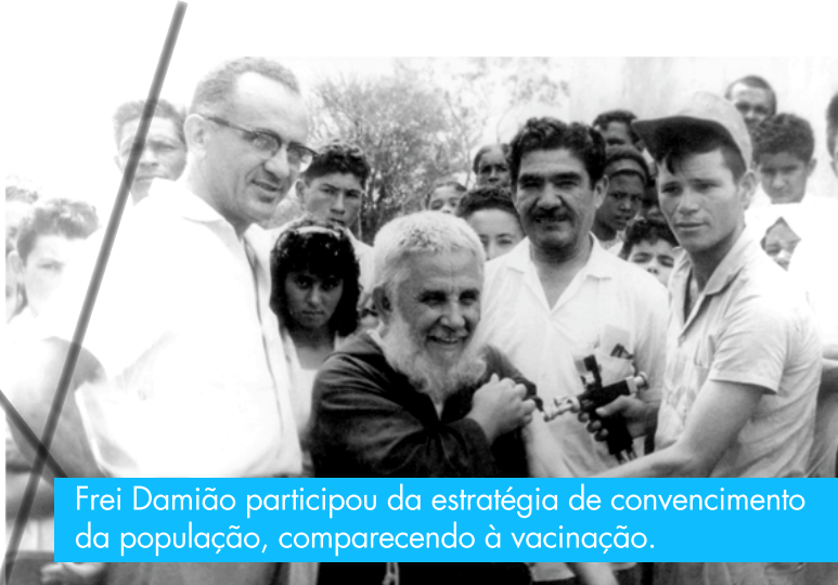
Frei Damião participou da estratégia de convencimento da população, comparecendo à vacinação.

Só recentemente, o homem conseguiu controlar estes males, deixando de atribuí-los aos demônios. Foram descobertos os vírus e as bactérias.